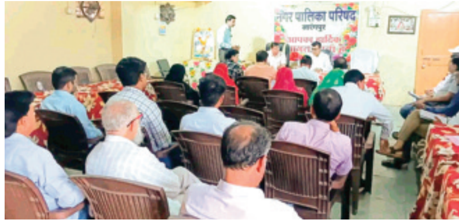
हरिभूमि न्यूज़ ▶▶ सारंगपुर