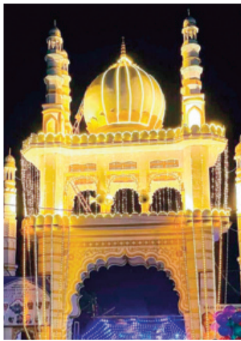
हरिभूमि न्यूज़ ▶▶ राजगढ़

राजगढ़ मुख्यालय स्थित बाबा बदख़्शानी पर इस साल लगे 112वें सालाना उर्स ने कई तरह के सवालता खड़े कर दिए हैं। मध्यप्रदेश शासन के अधीन आने वाले वक्फ बोर्ड भोपाल ने इस उर्स के संचालन की अनुमति सिर्फ 25 मार्च तक के लिए दी थी इसके बावजूद दरगाह कमेटी ने मनमानी करते हुए उर्स का संचालन 30 मार्च की रात्रि