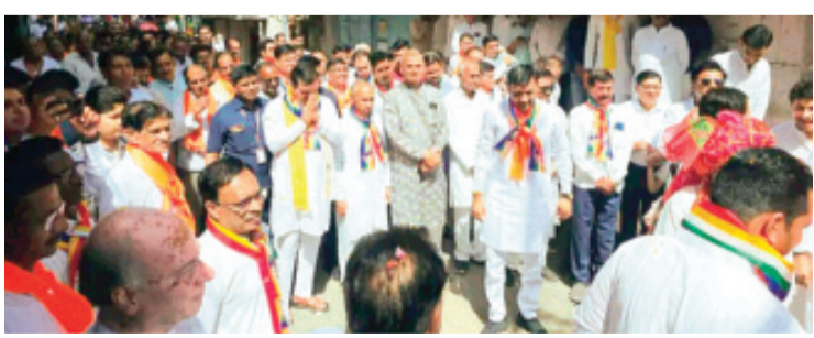
हरिभूमि न्यूज़ ▶▶ सारंगपुर

सकल जैन समाज द्वारा भगवान महावीर का जन्म कल्याणक महोत्सव पर शोभायात्रा निकाली गई। यात्रा श्री पाषाणथ दिगंबर जैन मंदिर से प्रारंभ हुई, जो सदर बाजार, महाकाल अनुसार आगामी दिनों में भी मौसम में उतार-चढ़ाव की संभावना बनी हुई है। नागरिकों को सतर्क रहने और तेज हवाओं के दौरान सुरक्षित स्थानों पर रहने की सलाह दी गई है।